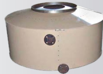
Sección SE con Cubierta Exterior