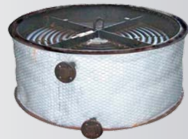
Sección SE sin Cubierta Exterior